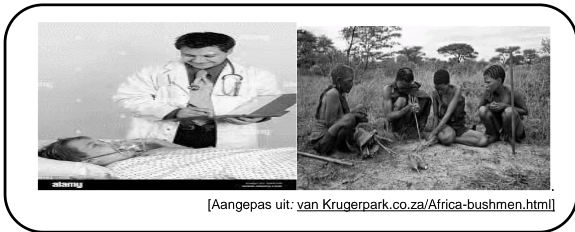
[Aangepas uit: van Krugerpark.co.za/Africa-bushmen.html ]

4.2 Skryf 'n paragraaf van 5-6 lyne om die verskil te verduidelik tussen inheemse genesing en Westerse medisyne. (5)