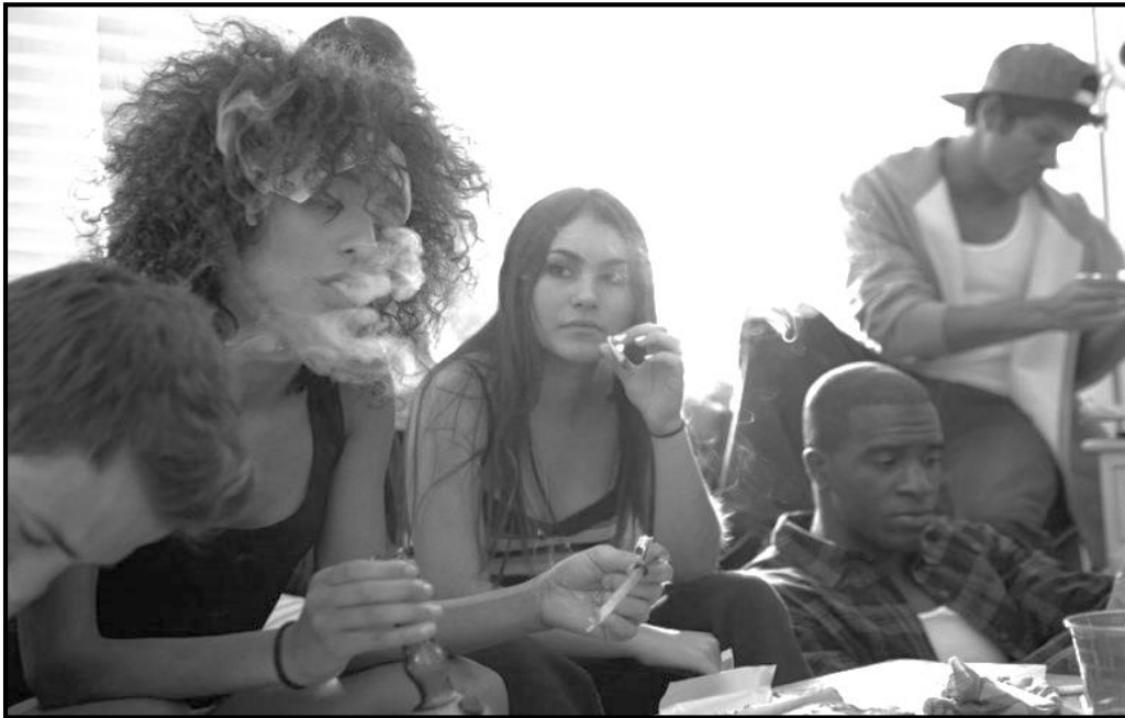
[Se nopotswe go tswa go inthaneteng]

1.2.1 Setlhangwa A le Setlhangwa B di bua ka ga eng? (2)