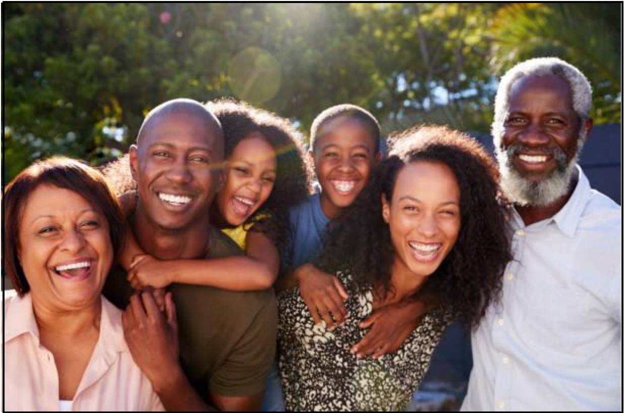
E nopotswe go tswa mo Outdoor Portrait of Multi-Generation Family In Garden ]

1.2.1 Naya dintlha di le PEDI tse SETLHANGWA A le SETLHANGWA B di farologanang ka tsona. (4)